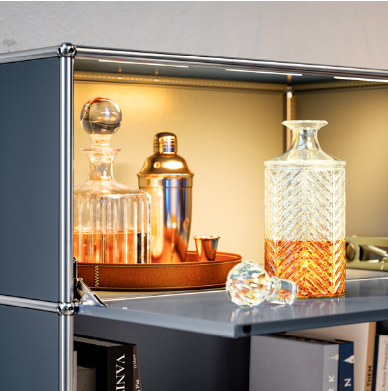
USM U. Schärer Söhne AG | Suisse

Les solutions de protection pour les surfaces très sollicitées, qui se distinguent par leur résistance élevée, offrent une réelle valeur ajoutée.